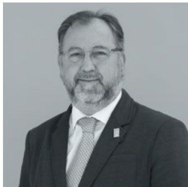
DARÍO CUESTA C. DIRECTOR NACIONAL ÁREA COMUNICACIÓN