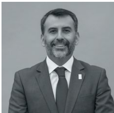
RICARDO LAGOS S. SANTIAGO CENTRO Y ESTACIÓN CENTRAL