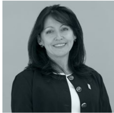
PAOLA ULLOA B. DIRECTORA NACIONAL ÁREA RECURSOS NATURALES